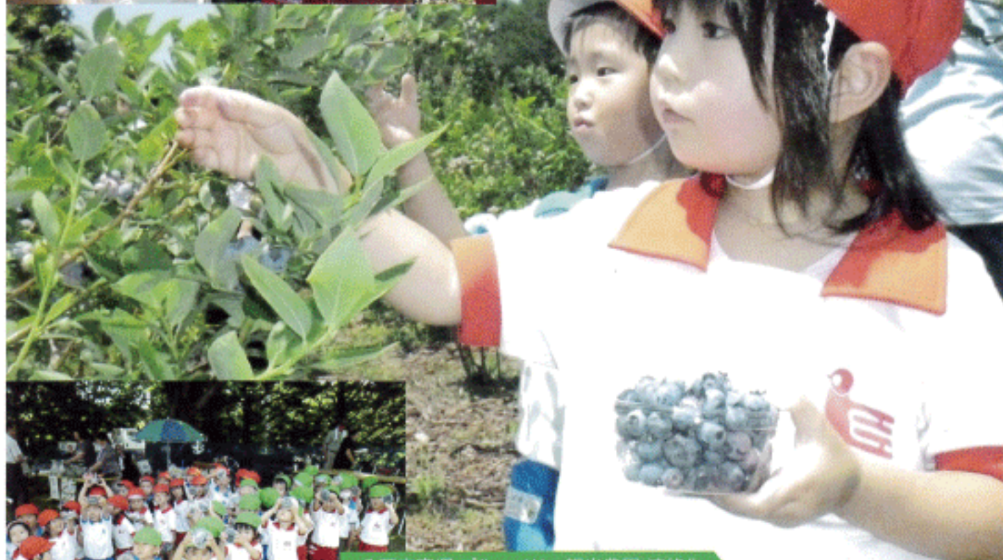
八戸市南郷 ブルーベリー観光農園 連絡先